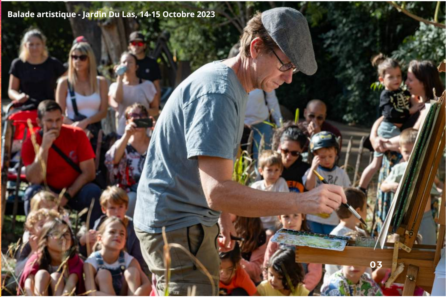
Balade artistique - Jardin Du Las, 14-15 Octobre 2023