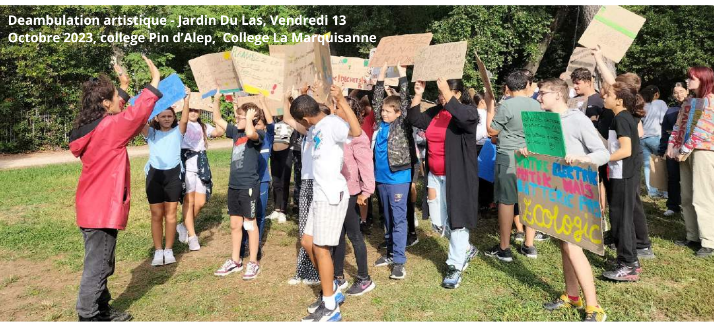
Deambulation artistique - Jardin Du Las, Vendredi 13 Octobre 2023, college Pin d'Alep, College La Marquissanne