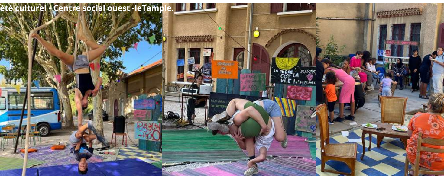
été culturel - Centre social ouest -leTemple.

Restitution dans le cadre des Nocturnes de Toulon Ouest le 20 juillet avec l'exposition des pancartes créées par les enfants et du numéro répété durant la résidence. Mise en place d'une scène ouverte avec les jeunes talents du quartier. Un repas partagé mêlant des plats proposés par les familles du quartier et le centre social.