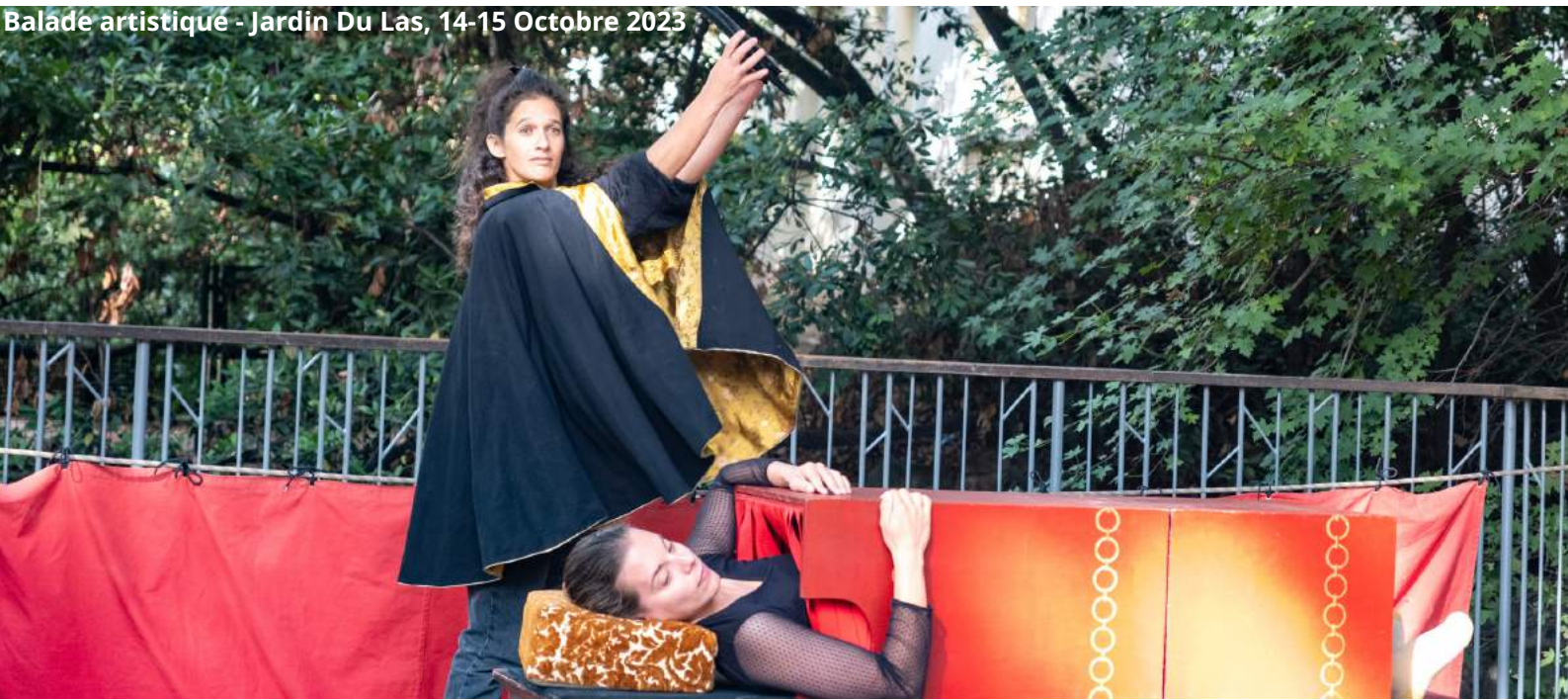
Balade artistique - Jardin Du Las, 14-15 Octobre 2023

IS FLE et Culture à France Terre d'Asile - CADA de Toulon