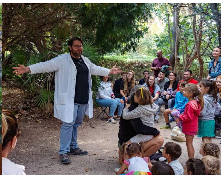
Balade artistique Jardin Du Las, 14-15 Octobre 2023