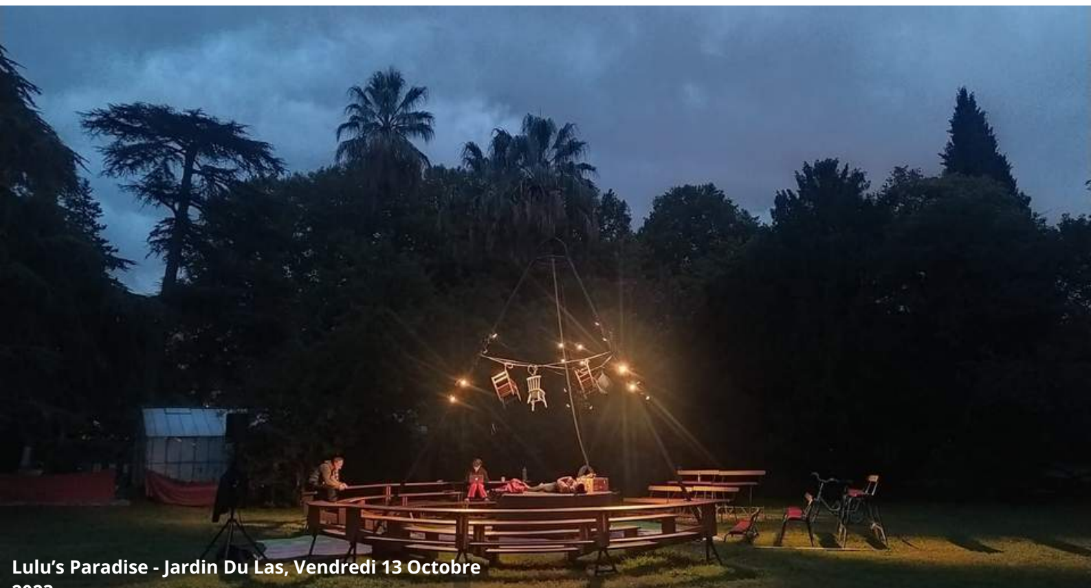
Lulu's Paradise - Jardin Du Las, Vendredi 13 Octobre 2023